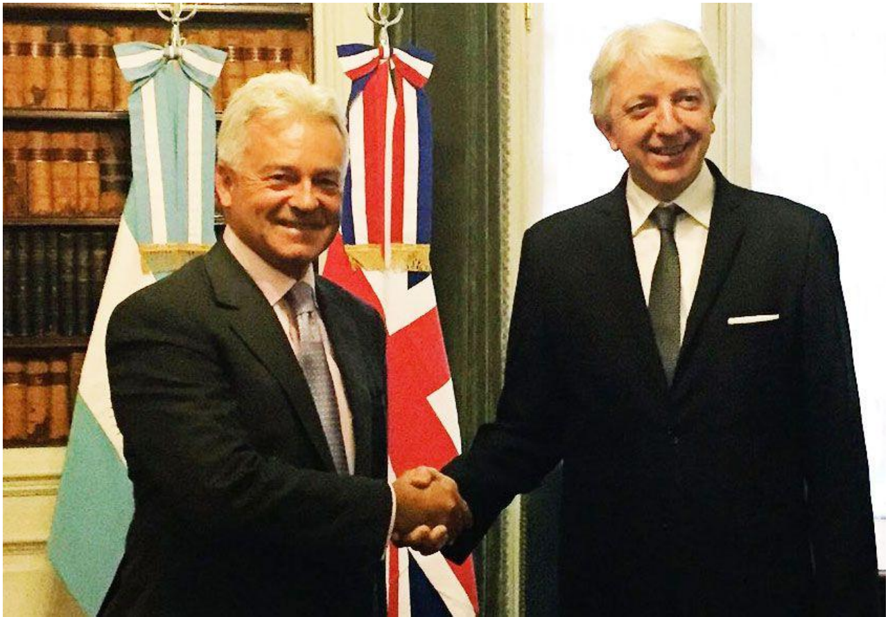
Sir Allán Duncan y Carlos Foradori

El comunicado expresa que la Canciller Susana Malcorra concedió una audiencia a Sir Duncan en su visita el 12 y 13 de septiembre de ese año, y que “ambas partes se comprometieron a poner énfasis en la agenda positiva de las relaciones con el objetivo de estrechar aún más los vínculos bilaterales, desarrollar lazos más cercanos y una sólida cooperación en beneficio de los pueblos de ambos países ” .