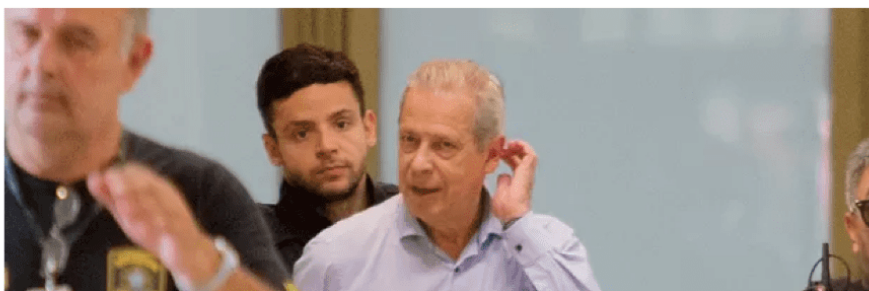
Archivo de Globo sobre la condena a Dirceu.

Dirceu fue dueño de una consultora llamada JD Assesoria e Consultoria junto con su hermano, entre los años 2006 y 2013 hasta que se destapó la olla y quedó bajo arresto. Se sospecha que en realidad JP era una empresa de fachada, que se encargaba de desviar fondos.