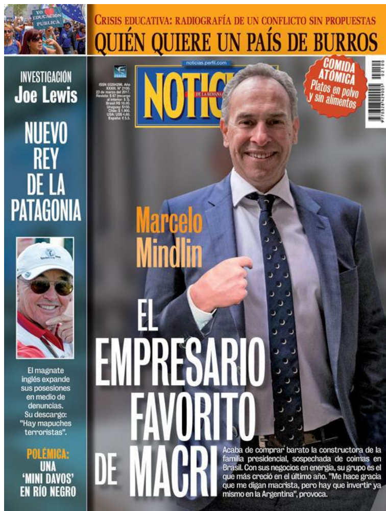
Portada de la Revista Noticias, luego de la compra de Mindlin de IECSA.

Mindlin tiene como socio al magnate inglés Joe Lewis, de quien el presidente Macri confesó en una conferencia de prensa que era su amigo, en pleno conflicto de la apropiación de tierras en Lago Escondido en la provincia de Río Negro. Además, Mindlin es el dueño de Pampa Energía, la mayor compañía eléctrica de la Argentina, beneficiada por los descomunales aumentos de tarifa lanzadas por el actual gobierno.