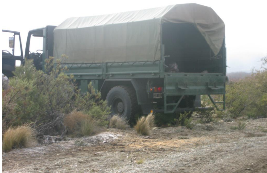
Camión Eurocargo GRS401

La cuestión se agrava aún más si se hace un análisis individual de los vehículos, comenzando por los del escuadrón de El Bolsón. Donde aparece que en el camión Eurocargo que ingresó al Pu Lof, patente GRS401, en realidad no se recogió dato genético alguno , dado que las siete muestras obtenidas en él, fueron desechadas por no contener material genético. Hablando esto a las claras de la profunda limpieza a la que había sido sometido. No obstante que se trata de vehículo de transporte de tropa, y resulta que es como si esta no hubiese existido.