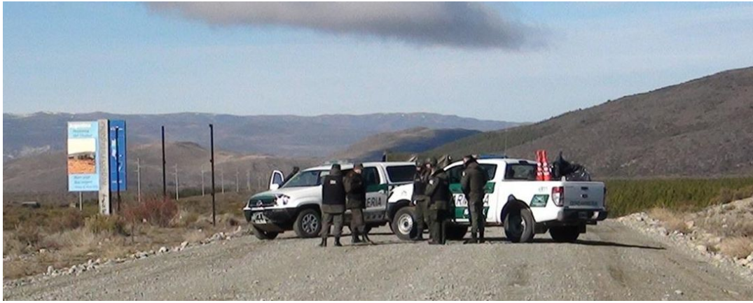
Camioneta con Ranger 0LW237 con dos conos y bulto negro ya afuera del Pu Lof

Esta cantidad y la referida a las muestras Cotejables del Unimog JYI842, se corresponden con la cantidad de pasajeros que pueden portar en su doble cabina. Destacándose además que la sospecha que recae sobre ambos vehículos del escuadrón de Esquel, es la de haber portado a Santiago Maldonado en su caja de carga.