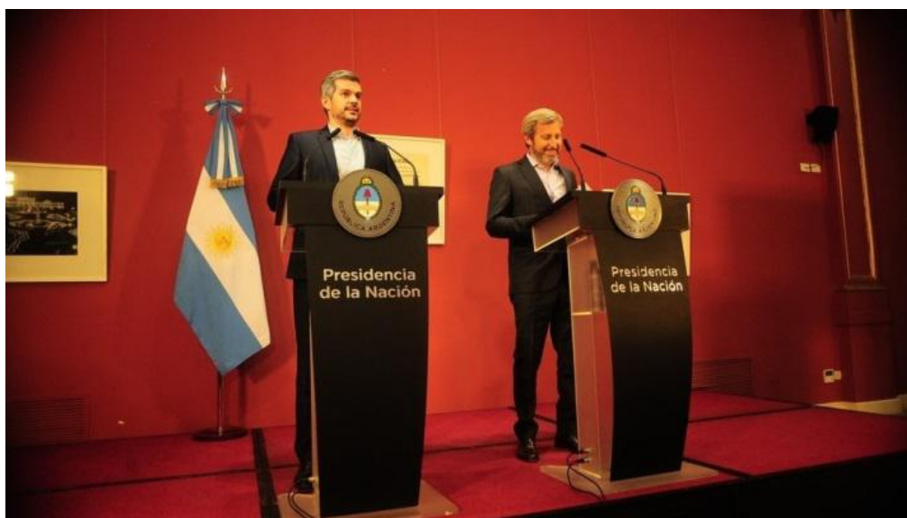
Jefe de Gabinete Marcos Peña y ministro de